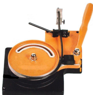
INO AHG 10/170