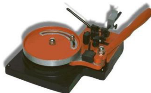
INO AAHG 10/170