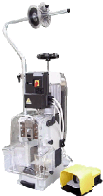
INO CPM - TT